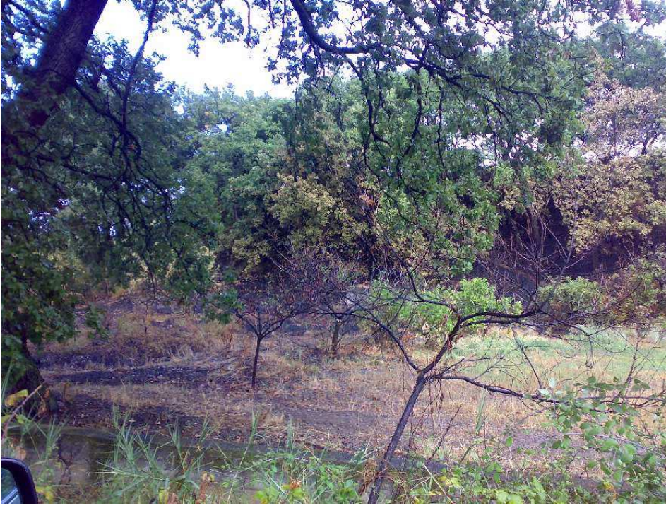
Greppa 167- Passobagni