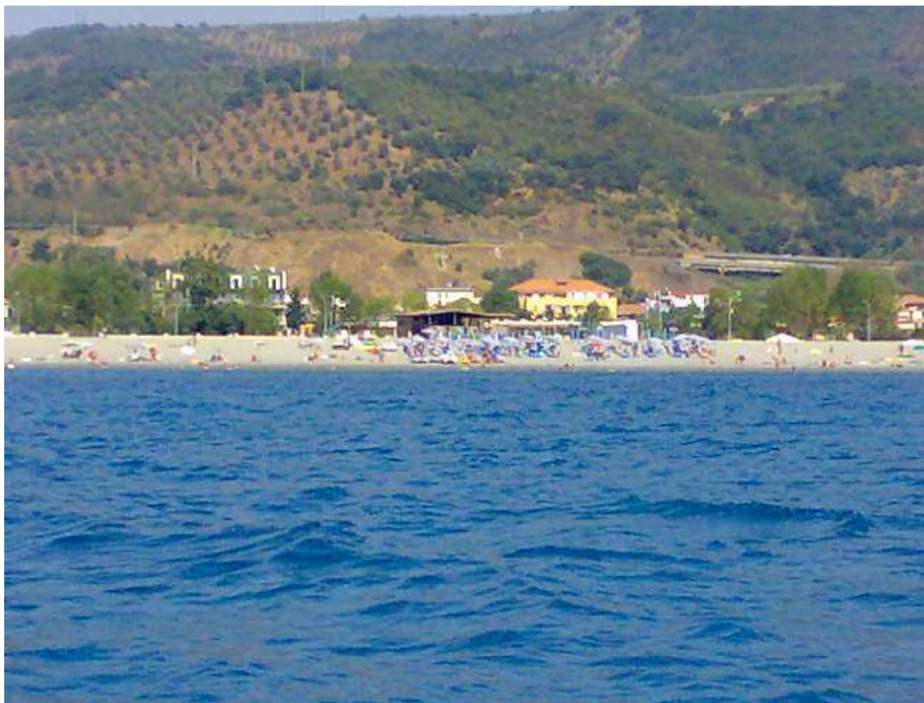
Lido Kalaugo confinante con il lungomare

● Archivio ● Ultime notizie ● Baratta vende