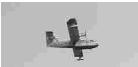
Il canadair in volo sulle colline di Nocera Terinese