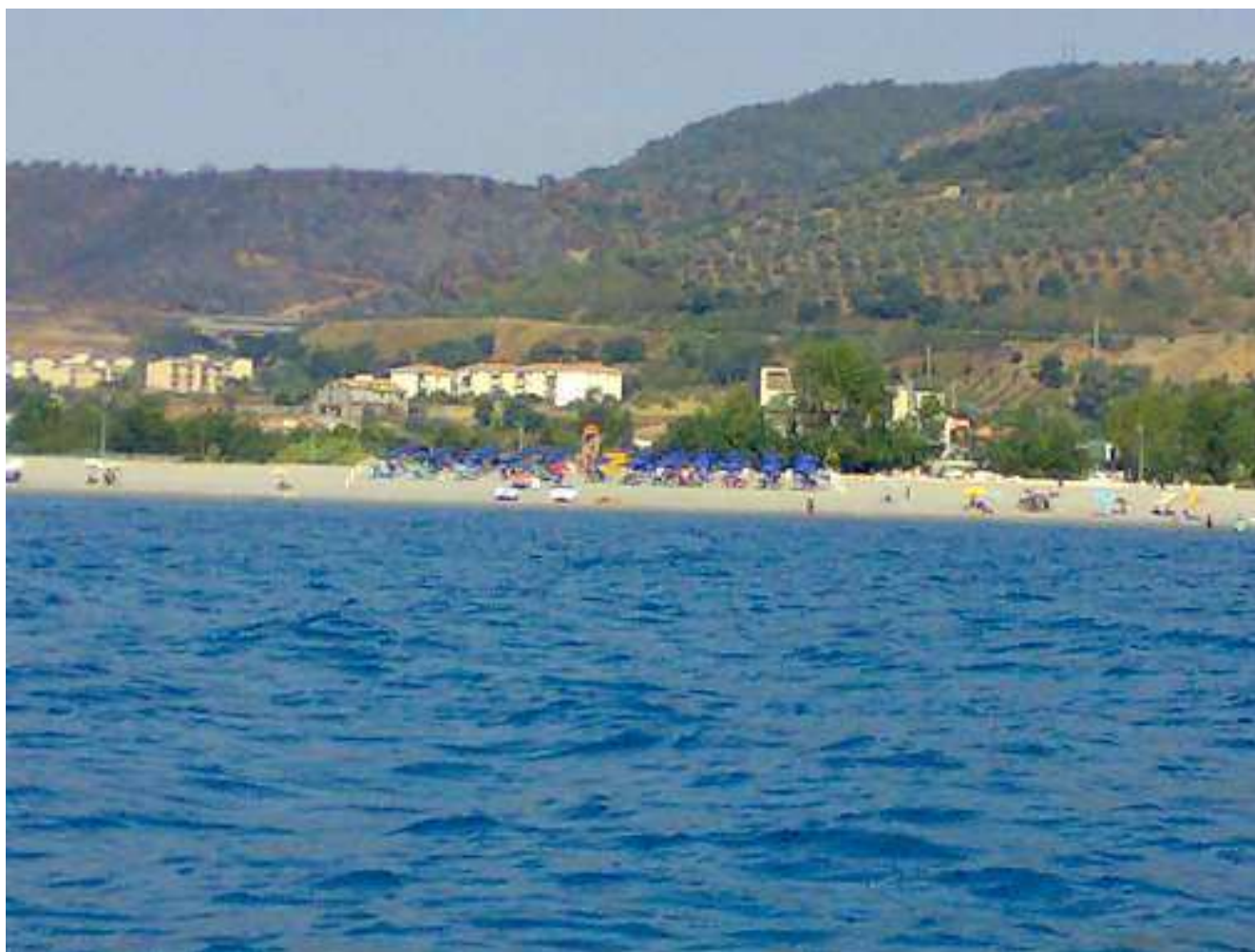
Zona devastata dal fuoco 22.8.07 -- Lido La Vela