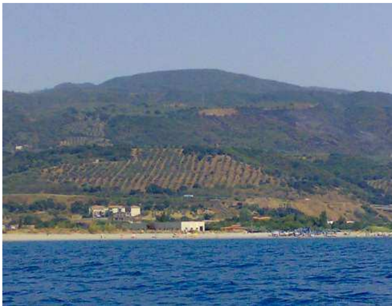
Uliveto de Luca, Capannone Ittico Caruso, Lido la Vela, zona devastata dal fuoco