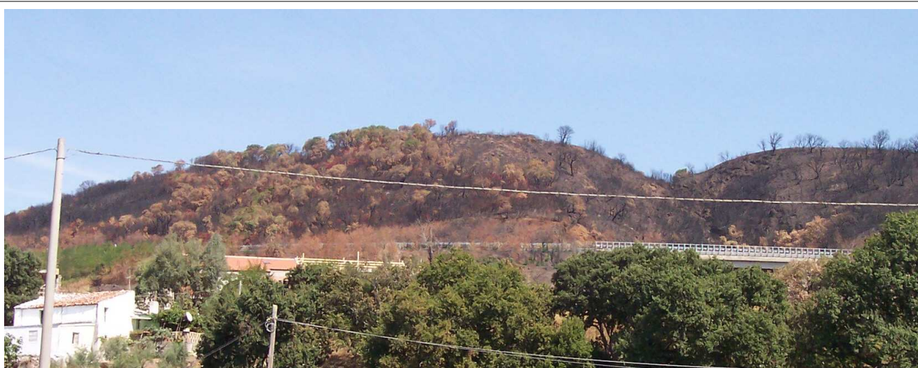
Fosso Sciabica - Zona devastata dal fuoco - Rione Ligea - Spiaggia libera la macchia