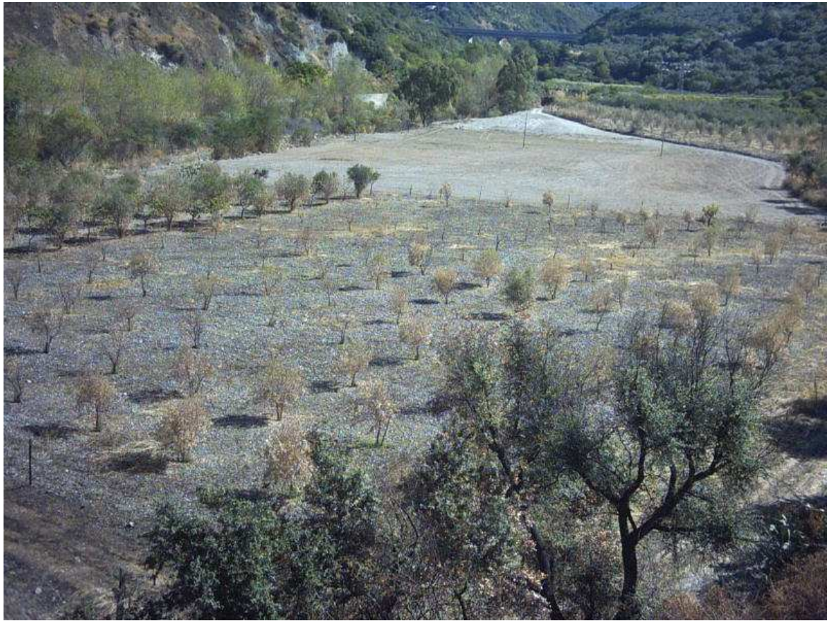
foglio 21 piante bruciate . Si vede il terreno oggi 7.9.07 lavorato